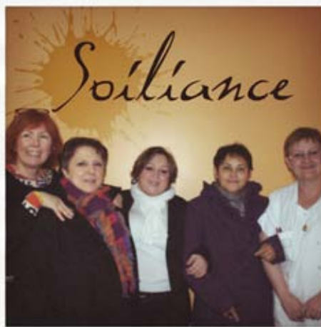
L'équipe de Chauny