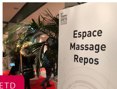
Congrès SFETD Montpellier

Cette année, nous nous sommes donc retrouvés au Corum de Montpellier lors du congrès de la SFETD (Société d'étude et traitement de la douleur), à Bordeaux avec le congrès de la SFAP (Société française d'accompagnement et de soins palliatifs) (photos page suivante), à Lyon avec le congrès du CEFIEC (Congrès des directeurs d'IFAS ou d'IFSI). Pour imaginer un peu ces direz voici quelques photos souvenirs de ces bons moments de partage.