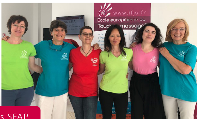
Congrès SFAP Bordeaux